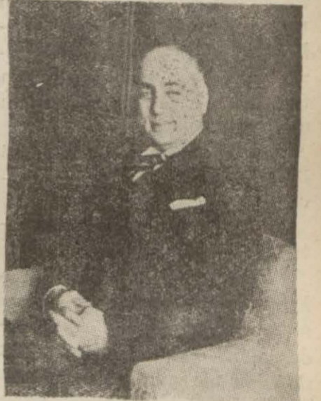
Adliye Vekili Hasan Menemencioglu

«El koyma ve tesbit edilmiş fiyatların kaldırılması kararı 24-7-942 tarihli. Takibat yapılamıyacağı hakkında Adliye Vekâleti emri 20-8-942 tarihli. Halbuki Temyiz mahkemesi 3 üncü ceza dairesi 1-9-942 günlü bir ilâmî ile böyle bir mahkûmluk kararını tasdik etmiştir. Bir başka teze göre kanun hükmü baki ve mer'i olduğu için fiil suç olmak gerektir.»