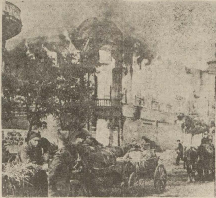
Şark cephesinin cenubunda Almanlar tarafından henüz işgal edilmiş bir kasaba

Kuvvetli hava teşhilleri muharebelere iştirak ederek Volganın şarkından yeni gelmiş olan Sovyet kuvvetlerine müessir taarruzlarda bulunmuşlardır. Şehrin şimalinde ve şarkında bulunan hava limanları gece bombalanmıştır. (Devamı 5 inci sayfada)